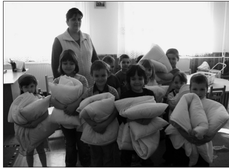
A kicsik örültek az új ágyneműnek