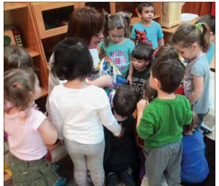
A Süni csoportosok kedvelt tevékenysége a buszos játék.