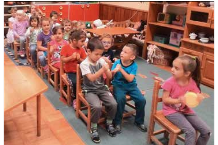
Nagycsoportban elmélyült játék folyik a barátokkal.